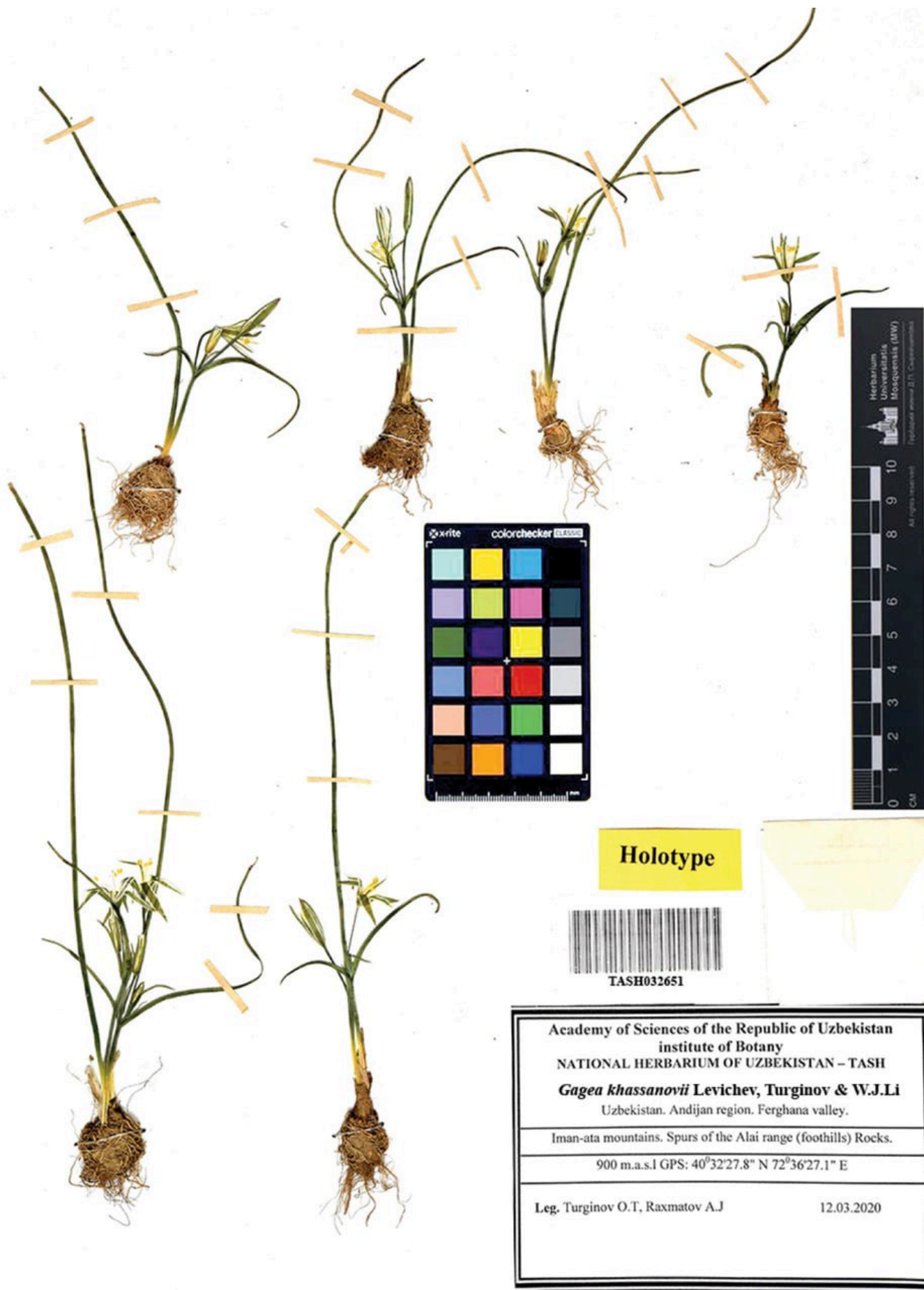
Gagea khassanovii gerbariy namunasi